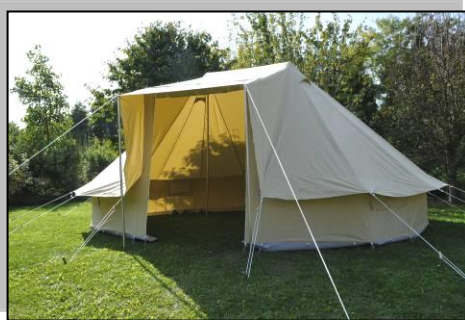
großer aufrollbarer Eingang 200cm Höhe!