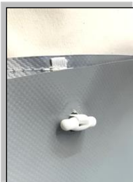
Befestigung der Bodenwanne