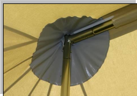
Mittelstangen in Rahmenkonstruktion ohne Ösen im Firstbereich!