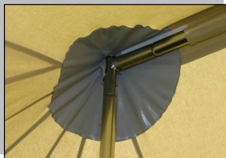
Mittelstangen in Rahmenkonstruktion ohne Ösen im Firstbereich!