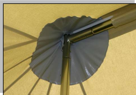
Mittelstangen in Rahmenkonstruktion ohne Ösen im Firstbereich!